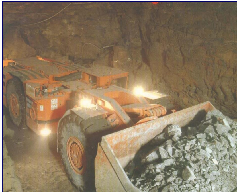
Figura 1: Pala LHD

A mediados de los años '50, se introdujo en Chile -en Mina El Teniente- el concepto de Subnivel de Ventilación (SNV) , el cual está conformado por galerías de INY. y EXT., desarrolladas para el manejo exclusivo de aire fresco de ventilación y aire contaminado de extracción. Desde el SNV, se distribuía el aire fresco (XC's de Inyección) -por medio de chimeneas de inyección- hacia los niveles